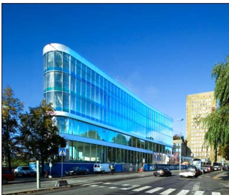
Statens musikbibliotek.

Utges av Arkiv- och dokumentationsavdelningen vid Statens musikbibliotek