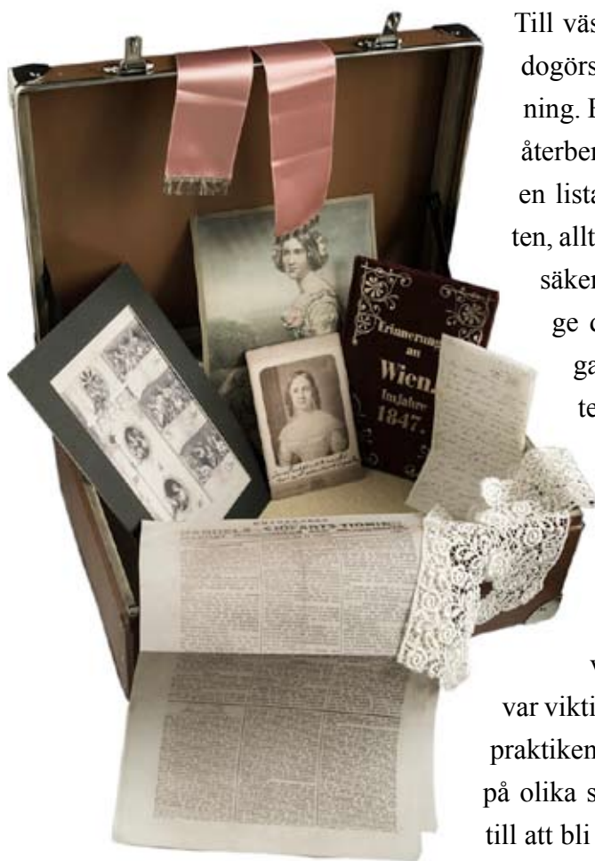
Jenny Lindväskan.

Musikmuseets pedagoger tillförde att väskan skulle innehålla en aktivitetslåda också. Där kom att ingå en mängd roliga och praktiskt användbara ting: en CD med Jenny Lind-musik; vi valde Regementets dotter eftersom flera andra dokument också anknöt till denna opera. Naturligtvis behövdes också noter att sjunga efter och bilder på olika rollkostymer. I Musikmuseet finns en klänning som Jenny Lind hade då hon som liten sjöng i Den polska gruvan; den fick komma med liksom ett klänningsmönster. En mer udda sak var receptet på Jenny Lind-pudding! Förstås lade vi också ner arkivvantar och en gammaldags skrivpenna. Till aktivitetslådans material hörde ett förslag på vad man kunde göra under lektionen, t. ex. att läsa ett par av HC Andersens sagor och försöka se hur de anknyter till Jenny Lind, Den fula ankungen och Näktergalen. Skiss över hur man bygger en teater i papp kom med liksom ett förslag på en Jenny Lind-promenad i Stockholm.