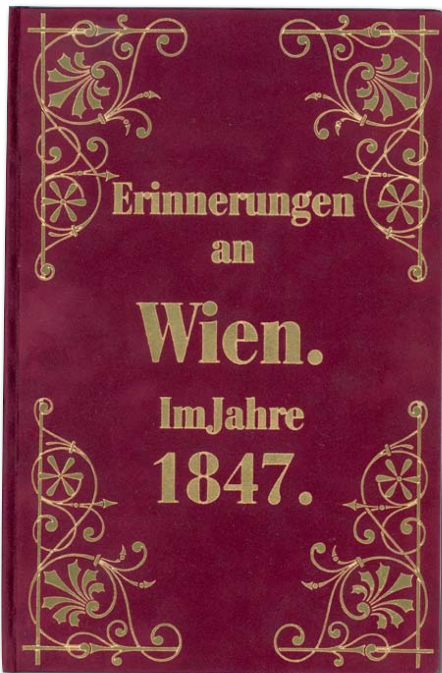
Replik av sammetsalbum med recensioner från Wien 1847.

De vackra dokumenten i väskan fick utgöras av konstverk eller ett sidenband; det senare hade troligen varit fästat kring något slags blomsterhyllning. Mycken möda lade vi också ner på att göra en replik av ett sammetsalbum innehållande recensioner från Jenny Linds framträdanden i Wien 1847; albumet hade hon fått som gåva av en beundrare.